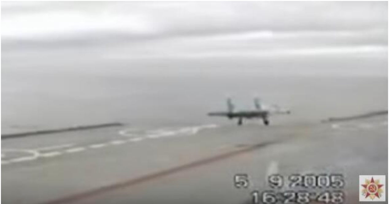
（资料图）2005年时一架苏-33舰载机因阻拦索断裂坠海

俄罗斯“库兹涅佐夫”号航母这次出击叙利亚从一开始就被负面消息纠缠，西方国家嘲讽冒着黑烟的俄罗斯航母是“重演第二太平洋舰队悲剧”（日俄战争期间俄将波罗的海舰队调往远东作战，结果遭到惨败）。继上月一架米格-29KUBR战斗机因航母阻拦索故障难以修复，耗尽燃油坠毁之后，12月3日，又一架俄罗斯苏-33舰载战斗机坠毁。事故原因据称是着舰时阻拦索断裂，飞行员弹射逃生，相关报道已经得到俄罗斯国防部确认。这次事故表明，俄罗斯“库兹涅佐夫”号航母确实存在带病参战的问题，其阻拦索系统很可能存在设计缺陷。中国“辽宁”号的阻拦系统是我国自行研制，与俄航母不同。