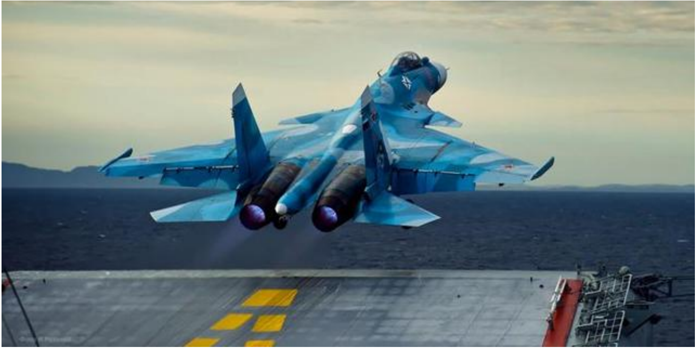
俄罗斯国防部公布的苏-33舰载机从“库兹涅佐夫”号航母上起飞的画面

12月5日，美国《航空家》网站报道称，美国国防部消息源透露，俄罗斯海军一架苏-33舰载机在12月3日试图在“库兹涅佐夫”号航母上降落时坠入地中海。